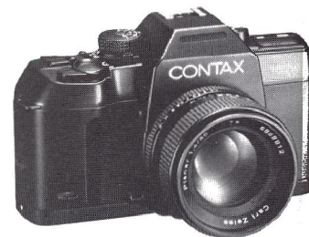
Contax 167 som den øvrige familie præget af stilrent design og smuk finish ...

Men hvori består så det nye? Først og fremmest er der nye eksponerings måder, lige fra re-