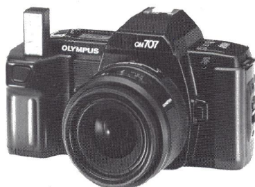
OM-707 repræsenterer et vendepunkt for Olympus: ikke kun har kameraet fået autofokus, det har også indbygget motor, flash, LCD panel og soft-touch betjening.

hvis kameraet bruges med ikke-AF objektiver.