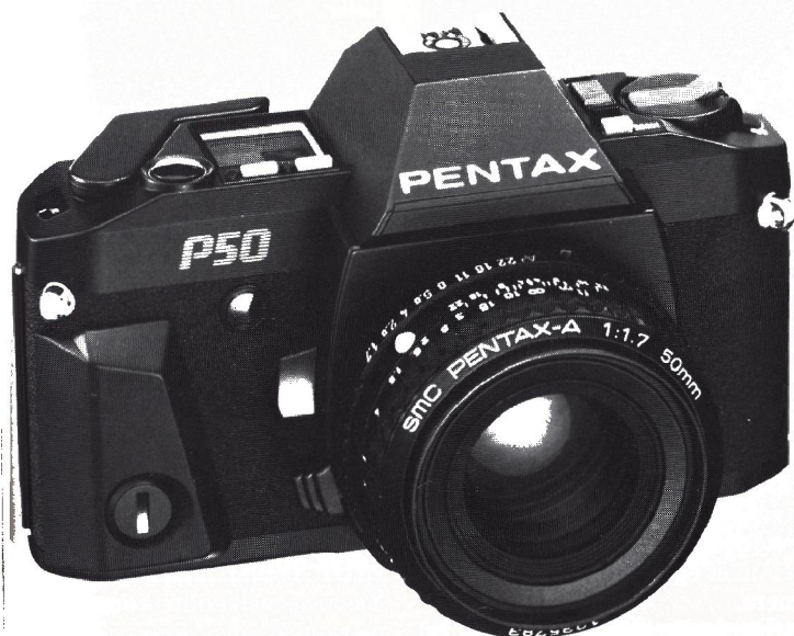
Pentax P50 er et prisoverkommeligt SLR-kamera med manuelt filmfremtræk - men til gengæld to forskellige eksponeringsprogrammer.

mar zoom og et antal originale Jesse Owens fotografier. Heraf skænkes små 5.000 kroner for øvrigt til den særlige Jesse Owens fond.