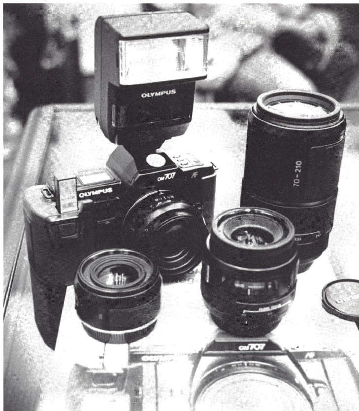
Olympus OM-707 med den første generation AF-objektiver samt den nye F-280 flash, som også på 707'eren tillader synkroniseringstider på 1/2000 sek.

707'eren er primært et familiekamera, som er enkelt at benytte. Der er tre forskellige programmer i automatikken. Det mest spændende regulerer lukkertiden (og blænden) i forhold til objektivets brændvidde, efter samme princip som hos Minolta. Desuden er der automatik med blændeforvalg, specielt egnet, 4-XI